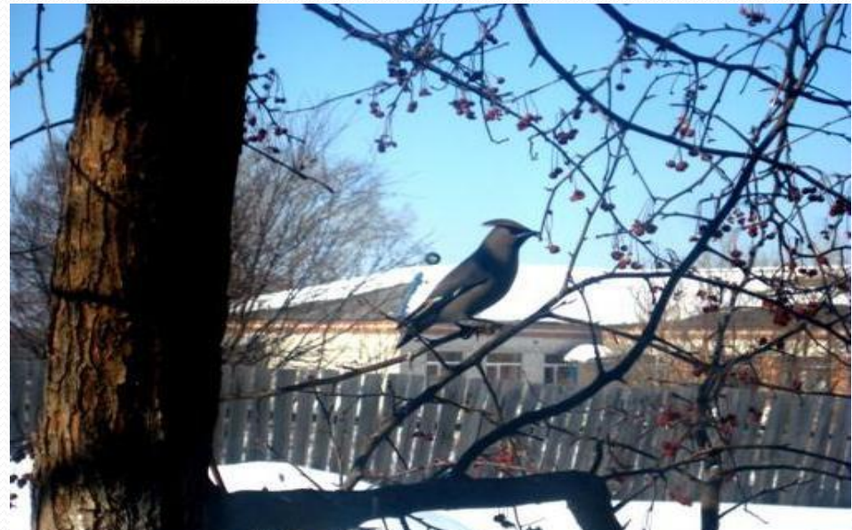
Перламутровка пафия, жук олень, свиристель, дятел.